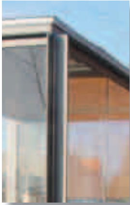
Design: Møller & Grønberg